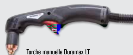
Torche manuelle Duramax LT